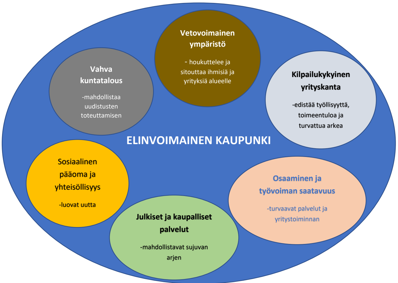
Kuva 1. Kaupungin elinvoiman kokonaisuus (Sini Sallinen toim., Kuntaliitto, Elinvoimainen kunta, 2011)

Suomen hallitus valmistelee parhaillaan elinvoimaisiin ja vahvoihin kuntiin perustuvaa kuntauudistusta. Kokonaisuutena kaupungin elinvoimaa voidaan tarkastella vetovoimaisen ympäristön, kilpailukykyisen yrityskannan, osaamisen ja työvoiman saatavuuden, palveluiden ja sosiaalisen pääoman ja yhteisöllisyyden sekä vahvan kuntatalouden näkökulmasta. Tämän elinkeinostrategian tavoitteena on myös osaltaan elinvoimaisuuden lisääminen Kaskisissa.